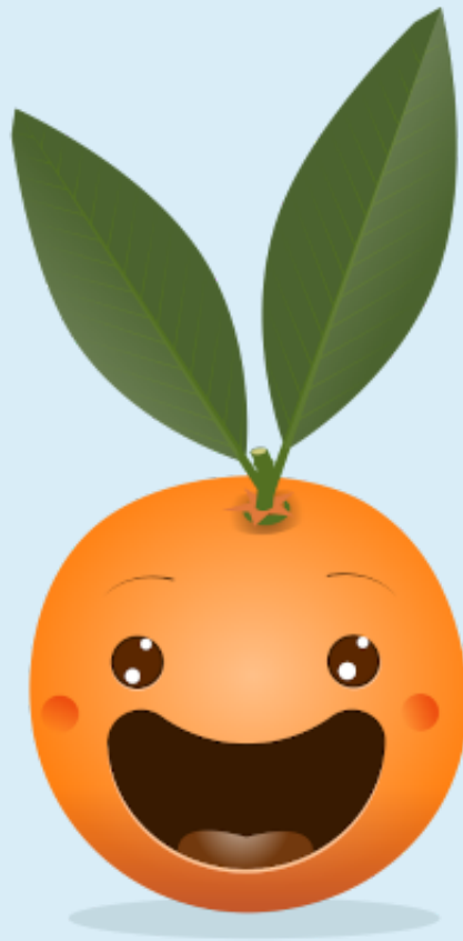
FIGURE 2.1. – Nous avons besoin de vous !

Contributeurs recherchés pour le projet technique !