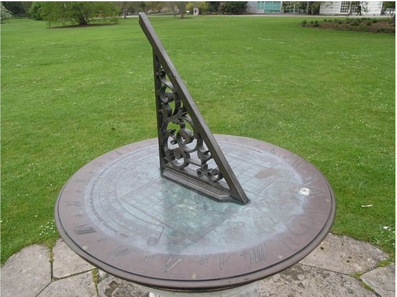
FIGURE 1.2. – Cadran solaire dans les Jardins botaniques royaux de Kew.

En ce temps-là, l'instrument de référence pour la mesure du temps est le cadran solaire. Il constitue une référence locale, et il y a autant de temps de référence que de cadrans solaires, car chaque endroit sur Terre voit le soleil se lever et se coucher à différents moments. Cela ne pose pas de problèmes majeurs, car les usages ne nécessitent alors pas de synchronisation précise sur de longues distances. Par exemple, la durée des longs voyages, où le décalage horaire est sensible, se compte en jours, et on est bien loin des déplacements à grande vitesse que permettront les moyens de transport qu'on connaît aujourd'hui.