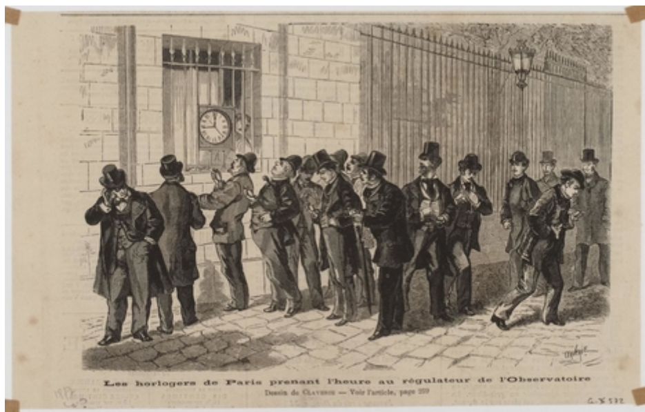
FIGURE 1.4. – Les horlogers de Paris prenant l’heure au régulateur de l’Observatoire, 1817.