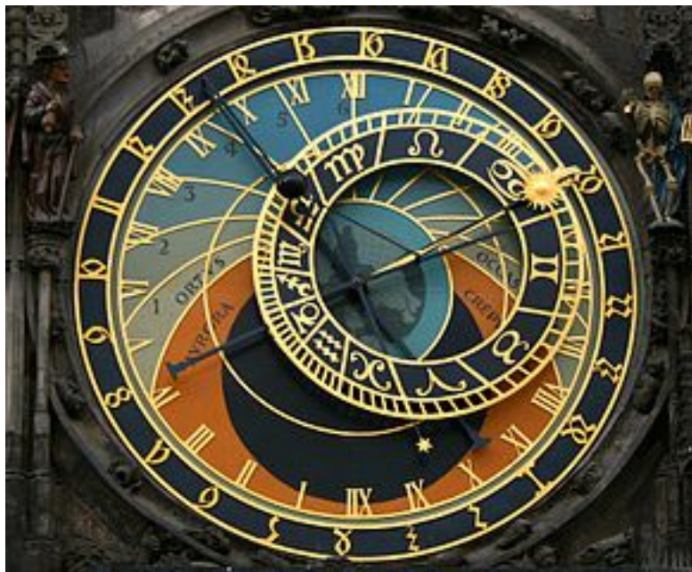
FIGURE 1.3. – L'horloge astronomique de Prague, construite vers 1500.

parfois douze parties, mais jamais soixante. Il faut attendre le 16 e siècle pour voir apparaître des horloges découpant l'heure en soixante minutes. À la fin de ce siècle, on voit aussi l'émergence des premières horloges indiquant les secondes, mais il faut attendre le 17 e siècle, et l'apparition des horloges à pendule, pour qu'elles soient assez précises pour être utilisées en pratique.