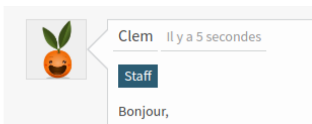
FIGURE 2. – Exemple de casquette.

Pour résoudre ces problèmes, Zeste de Savoir implémente désormais depuis cette version un système de casquettes fortement inspiré de celui en vigueur sur Lobsters .