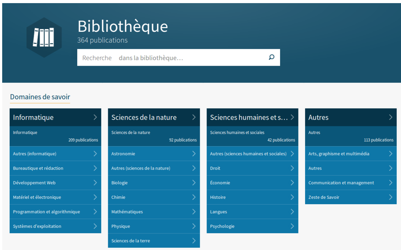
FIGURE 1. – L'accueil de la bibliothèque.

Même si une évolution du design est prévu sur les sections tribune et forum , la section qui nous intéresse dans cette release est la bibliothèque.