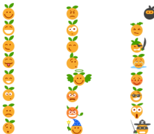
FIGURE 3. – Les nouveaux smileys.

Un grand merci à Buddy qui a fourni ces superbes smileys. Si toutefois ces smileys vous dérangent, vous avez la possibilité d'utiliser les anciens smileys dans vos paramètres.